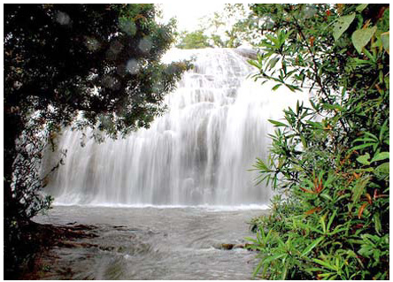
ഉള്ളച്ചാട്ടങ്ങൾ ഏതു ജില്ലയിൽ- ഇടുക്കി