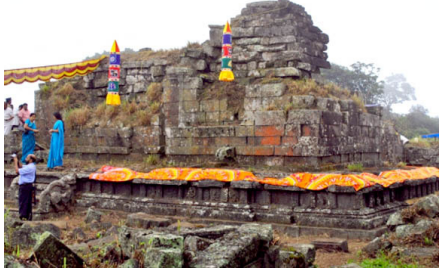
136. മംഗളാദേവി ക്ഷേത്രത്തിന്റെ ഭൂരിഭാഗവും കേരളത്തിലും ബാക്കി തമിഴ്നാട്ടിലുമാണ്. പെരിയാർ വന്യജീവി സങ്കേതത്തിലെ ഇടതിങ്ങിയ കാട്ടിനുള്ളിലെ ക്ഷേത്രമാണിത്.